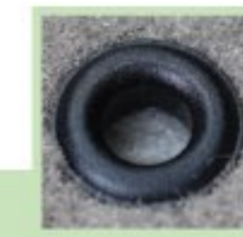
JENIS DAIL 旋转锁

Periksa dengan kerap untuk memastikan bahawa alas lantai sentiasa terikat dengan klip atau cangkuk! 应定期检查夹锁或钩锁, 以确保夹锁或钩锁没有松脱!