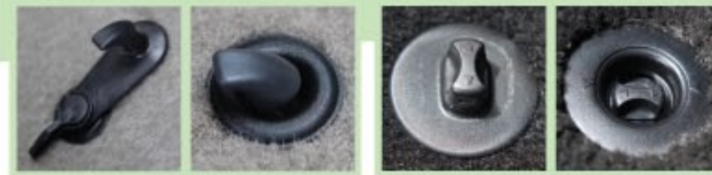
JENIS CANGKUK 钩锁

Pastikan bahawa alas lantai dipasang pada klip yang disediakan 确保已经扣紧备有的夹锁